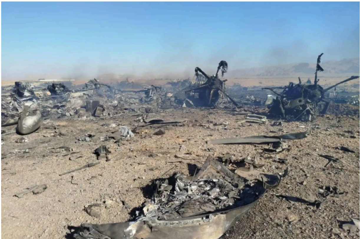
Das Ergebnis einer amerikanischen Kommandoaktion