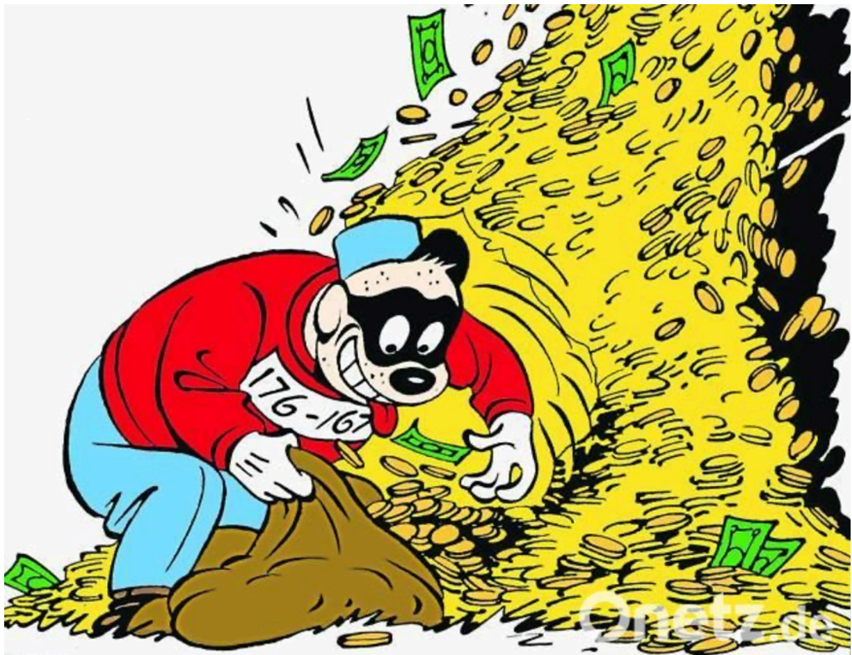
Panzerknacker bei der Arbeit

Der grösste Vorteil von physisch gehaltenem Gold liegt nun darin, dass es den beschriebenen Gegenparteirisiken nicht ausgesetzt ist. Das einzige Risiko, das eine Person hat, falls sie Gold physisch hält, liegt im Diebstahl. Dagobert Duck kann ein Lied davon singen.