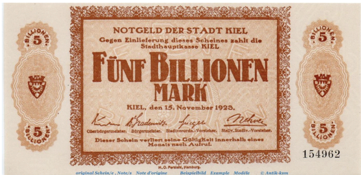
5 Bilionen Mark Geldschein von 1923

Eine Zentralbank kann nicht pleite gehen, da sie unbegrenzt Geld drucken kann und somit ist es theoretisch unmöglich, als Halter von einer Banknote, alles zu verlieren. Ich verwende das Wort «theoretisch», weil es praktisch durchaus möglich ist und auch schon passierte.