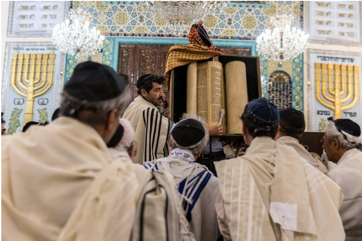
Jews in a synagogue in Iran

Antoun Ananias: Das ist eine besonders interessante Frage - was von beiden Seiten verschwiegen und verdrängt wird, sind die außerordentlich langjährigen und komplexen kulturellen, sozialen und kommerziellen Beziehungen zwischen den Ostjuden und ihren arabischen Freunden und Nachbarn. Die arabischen Staaten wurden durch den Verlust ihrer jüdischen Gemeinden erheblich geschwächt - und verloren einen Teil ihres eigenen zerbrechlichen Erbes und ihre Ganzheit als politisches und soziales Ökosystem. Die tragische Vertreibung der Palästinenser löste eine ebenso traumatische Vertreibung der Ostjuden aus. Diese Entwurzelung hinterließ bei denen, die weggingen, und bei denen, die zurückblieben, zahlreiche Lücken und Wunden, deren Vermächtnis vielleicht nie geheilt wird, solange die Ostjuden ihren früheren arabischen Kontext nicht akzeptieren. Traurigerweise zelebriert nur eine verschwindend kleine Gruppe israelischer Denker noch aktiv die ostjüdische Tradition, die ebenso reich ist wie die aschkenasische Tradition, obwohl es viele Spannungen zwischen den beiden Gruppen gab, die erst durch jahrzehntelanges Social Engineering und manipulative staatliche Politik in Israel mehr oder weniger verdrängt und begraben werden konnten.