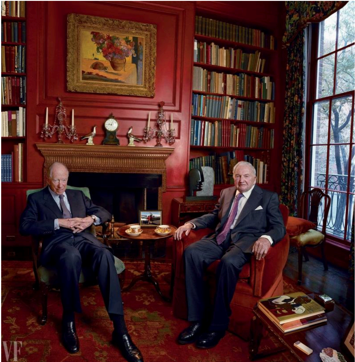
Philanthropen unter sich: Lord Jacob Rothschild, vierter Baron Rothschild, und David Rockefeller in der Bibliothek im Stadthaus von David Rockefeller in New York, Mai 2012

Sie trugen massgeblich dazu bei, dass die USA ihre wirtschaftliche Souveränität verloren. Sie waren nun vollständig unter der Kontrolle der „Finanzmärkte“ – und mit ihnen der gesamte kollektive Westen, der dieses System nicht nur bereitwillig übernommen, sondern nach Kräften gefördert und ausgebaut hat, bis hin zu seiner eigenen Deindustrialisierung.