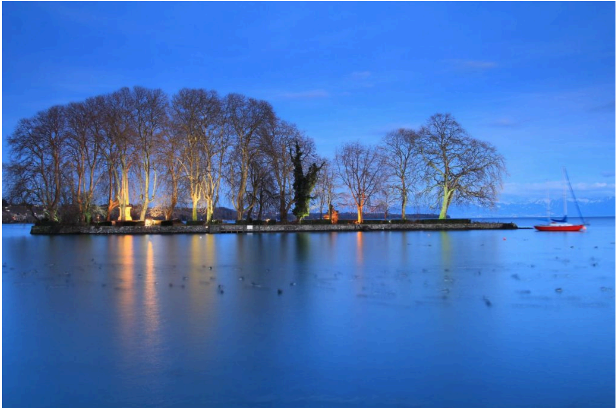
«Je dois tout ce que je suis à un Suisse»